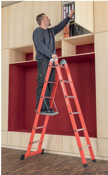
Abb. Bestell-Nr. 116125 mit Bestell-Nr. 19910